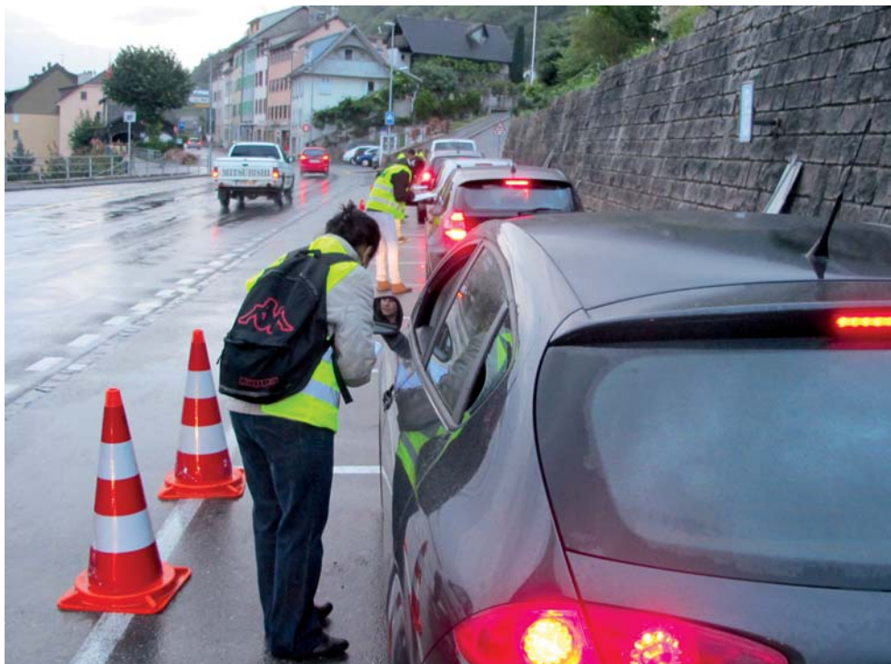
Plus de 700 questionnaires aux frontières ont permis de mettre à jour et quantifier le flux pendulaire dans le cadre du projet Interreg Covoiturage dans le bassin lémanique.