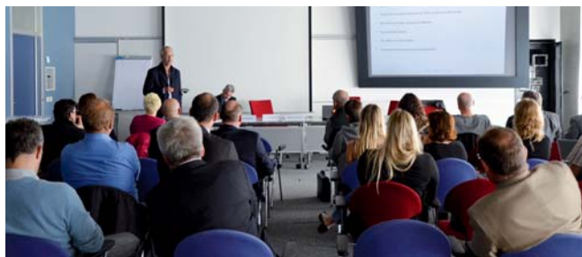
GENILEM Valais a mis sur pied un événement Innovation dans le tourisme pour les entrepreneurs et futurs créateurs d'entreprise.