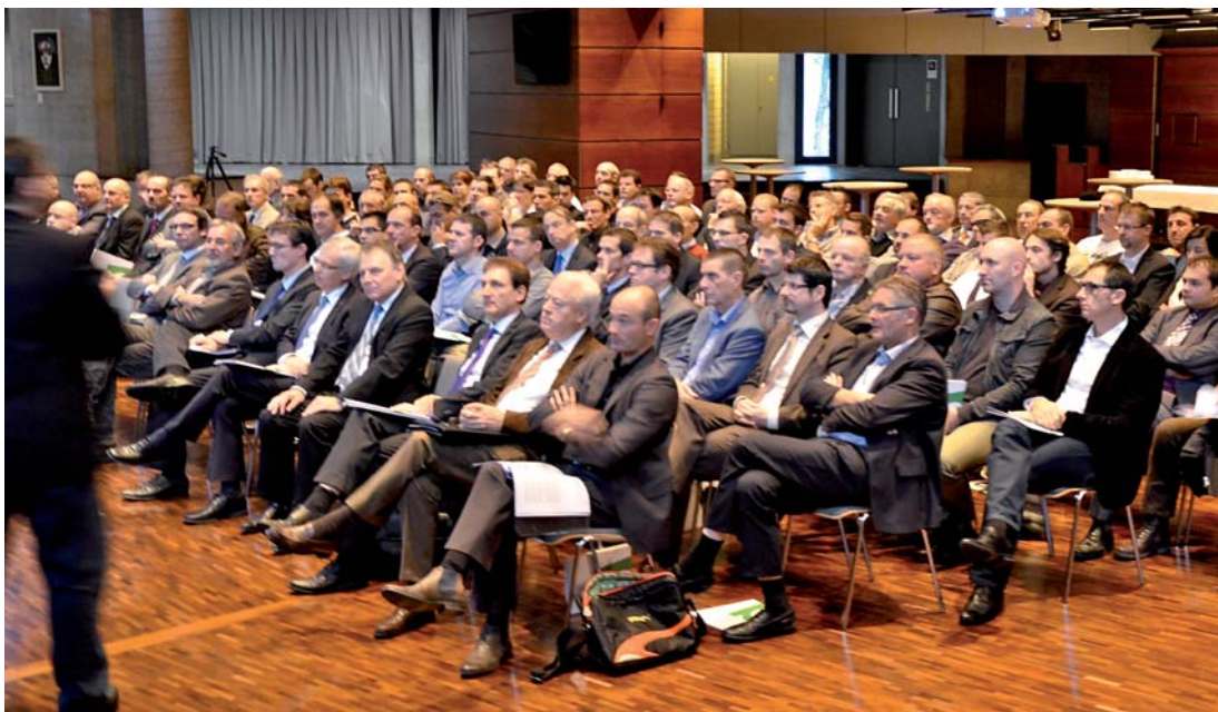
A l'exemple de Monthey, où plus de 100 entrepreneurs de l'ensemble du district ont répondu présents, les petits-déjeuners ont rencontré un succès sur l'ensemble du Valais romand.

Le Service de l'énergie et des forces hydrauliques a également présenté, lors de ces rencontres, le programme cantonal de soutien dans le cadre de la rénovation énergétique. Une information utile aux