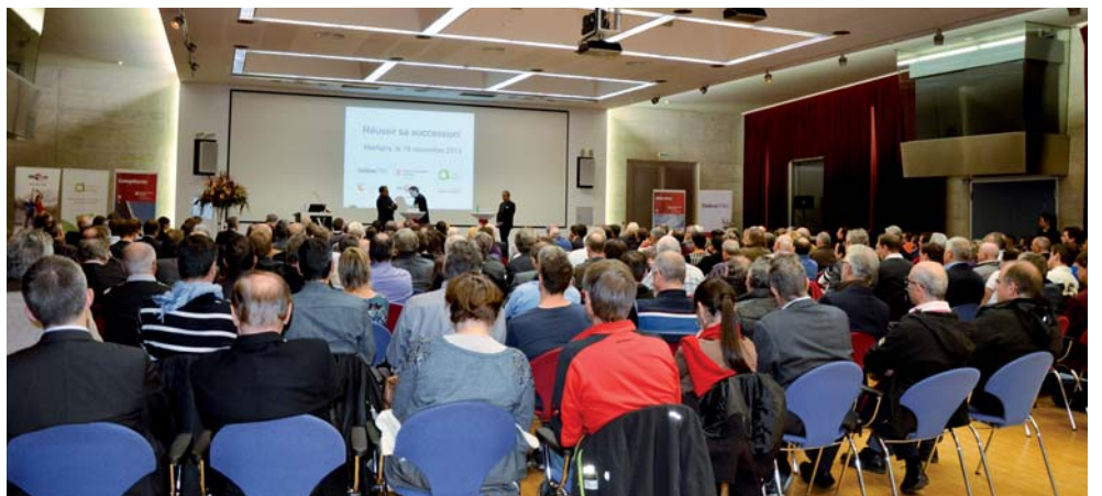
La succession en entreprise, une thématique qui a attiré un public venu nombreux trouver des pistes de réussite.