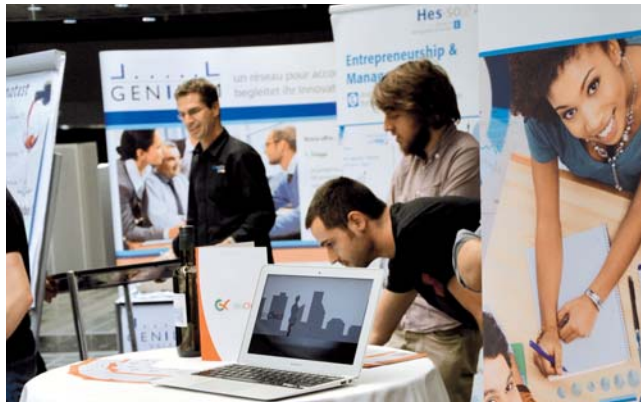
La HES-SO Valais-Wallis a profité de différents stands pour présenter les innovations et technologies des instituts de la HES-SO au service des entreprises.